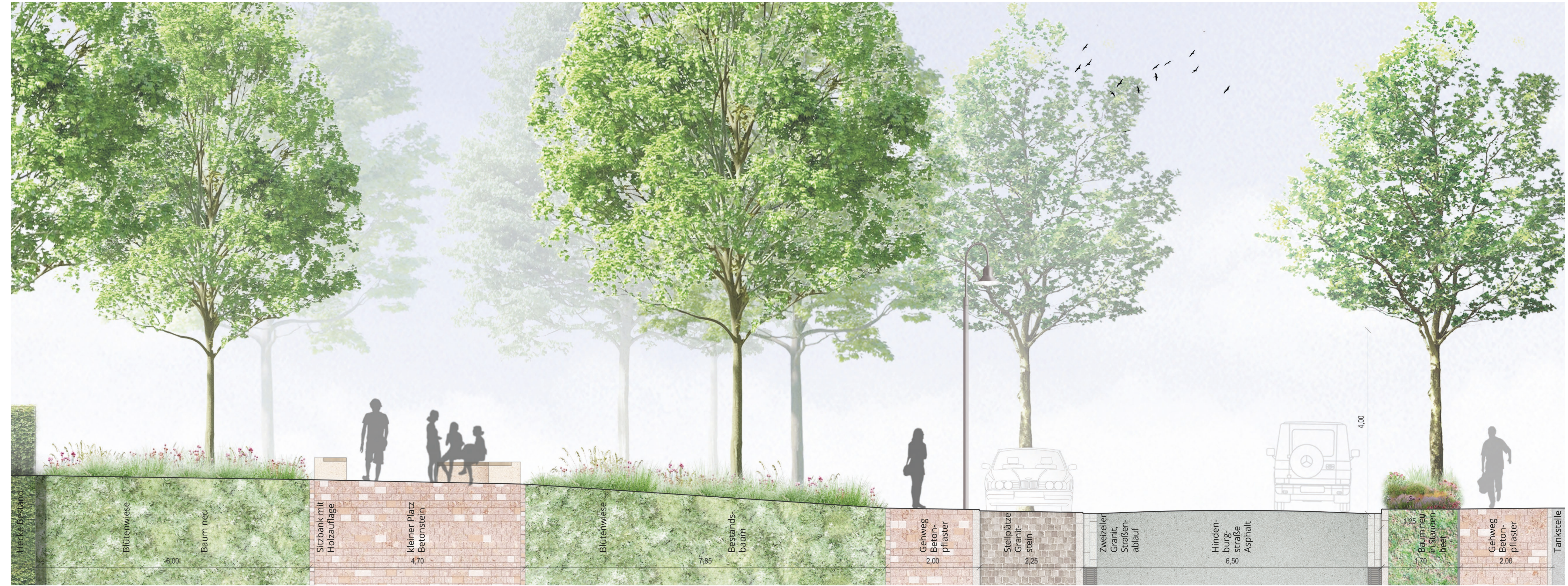
Schnitt B - B' mit Belagsdetail | M 1:50