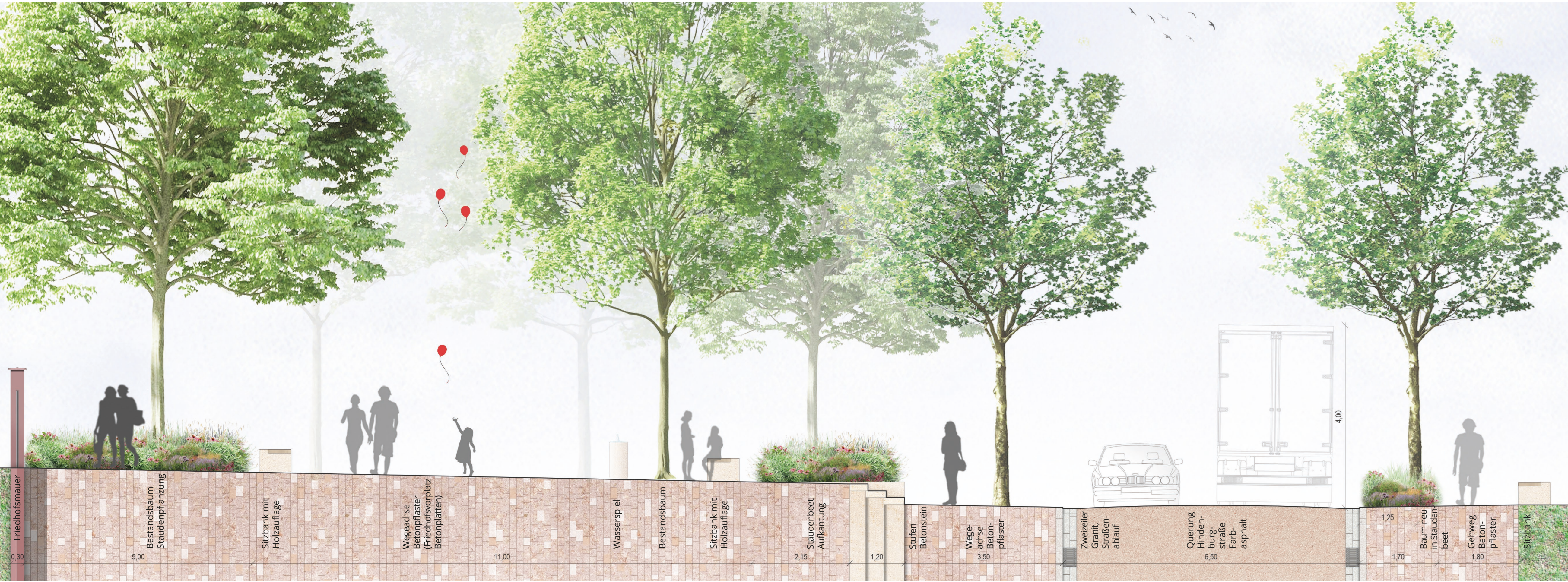
Schnitt A - A' mit Belagsdetail | M 1:50