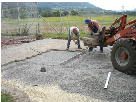
Mitarbeiter des Bauhofs bei der Arbeit

Die Sprunggrube an der Hohensteinhalle macht Platz für eine große Fahrradabstellanlage .