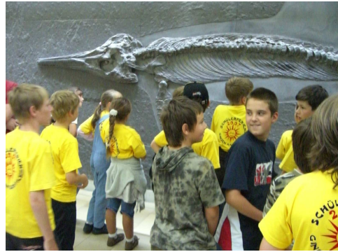
Teilnehmer im leuchtenden Gelb: So wird die Betreuung erleichtert