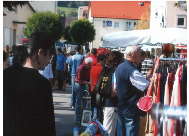
Treffpunkt für Viele: Sunday ist Funday

Bei einer Einbruchserie in der Gartenanlage Schnait werden sechs Gartenhäuser aufgebrochen.