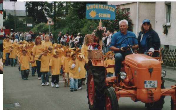
„Fest der Farben“ – Thema des traditionellen Festzugs

Unter einem riesigen Zelt Dach, das von einem Autokran gehalten wird, ist der Parkplatz an der Hohensteinhalle an drei Tagen Treffpunkt für Jung und Alt. Freitag: Spiel ohne Vereinsgrenzen mit 13 Mannschaften; Samstag: Kinderfest unter dem Motto „Fest der Farben“, am Abend Hock und Ü30-Party; Sonntag: Ökumenischer Gottesdienst, Frührschoppen und Jugend-Fußball-Turnier. Ausrichter und Besucher sind mit dem „neuen Weg“ sehr zufrieden.