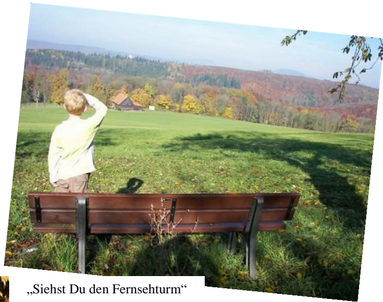
„Siehst Du den Fernsehturm“