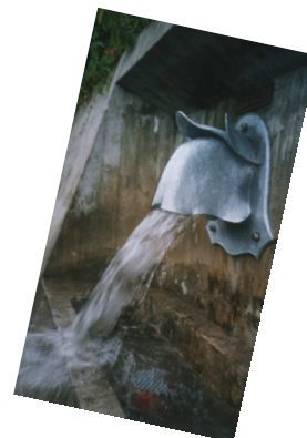
„Jetzt läuft er wieder...“

Mit 10 neuen Spielern aus der eigenen Jugend starten die Fußballer in die Saison 2007/08.