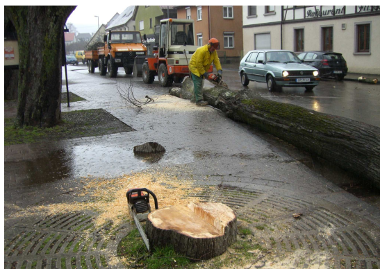
Leben und Sterben – auch in der Natur

Das Innere des Rathauses ist nun durch eine automatisch reagierende Schiebetür zu erreichen.