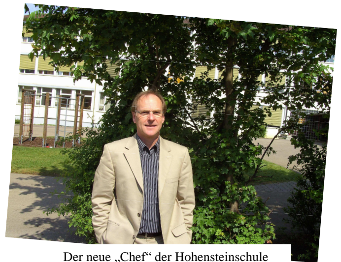
Der neue „Chef“ der Hohensteinschule

Die Fliegergruppe ist stolz auf ihren „ B-Spatz “, der vor 50 Jahren komplett selbst gebaut wurde und heute noch voll funktionsfähig ist.