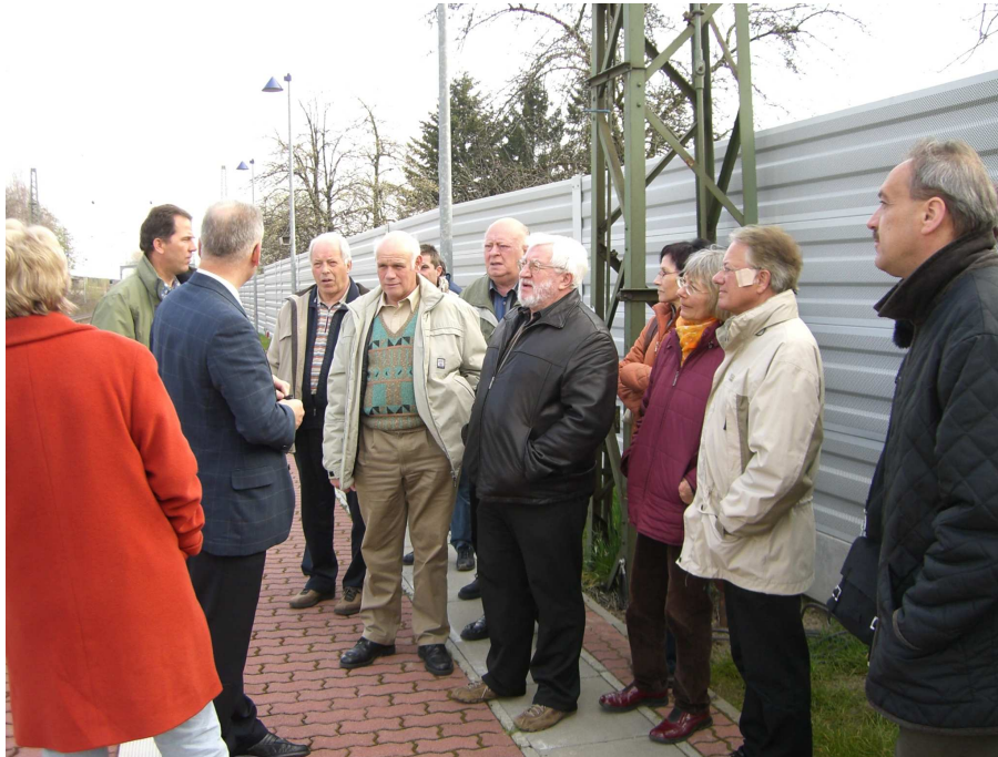
Besichtigungsfahrt Lärmschutzwand des Gemeinderats

Kommentar der Geislinger Zeitung: „Gericht wird wohl im Kirchturmstreit entscheiden müssen.“ Auch der Staatsanzeiger Baden–Württemberg, das Fernsehen und der Rundfunk des SWR beschäftigten sich später mit den Meinungsverschiedenheiten über die Gültigkeit des Vertrages aus dem Jahr 1890.