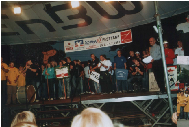
Spiel ohne Vereinsgrenzen

Kindergärten, Schule und Vereine legen die Traditionsfeste der Gemeinde zusammen und führen unter der Leitung des Kultur- und Sportkreises die ersten Schnaki-Festtage ( Schnapperfest und Kinderfest ) durch.