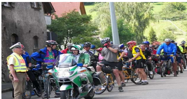
Warten an der B10 unter Polizeischutz

Die von SWR4 und SWR Fernsehen organisierte „ Tour de Ländle “ streift auf ihrem Weg vom Täle nach Donzdorf und Schwäbisch Gmünd mit 3000 Radfahrern die Gemeinde.