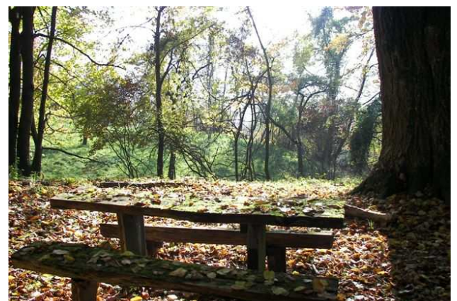
Auf dem Rückweg: Halt bei den Sedans Linden