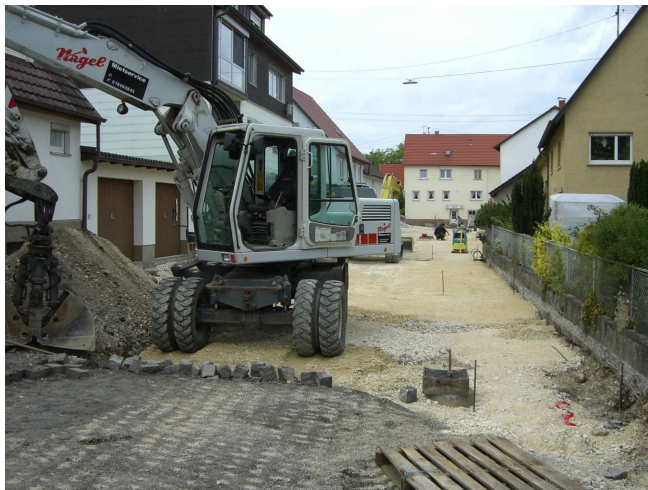
3. Bauabschnitt: Fertigstellung der Hinteren Gasse

Der Gemeinderat beschließt: Um die Sicherheit der Schülerinnen und Schüler zu verbessern, werden die Geländer in allen drei Bauteilen der Hohensteinschule für 27.000 Euro erhöht;