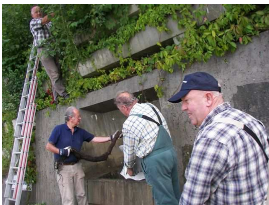
Die Siebzigjährigen im Einsatz

Der Brunnen an der Bahnunterführung (in den 80er Jahren des vergangenen Jahrhunderts mit Baukosten in Höhe von 6,3 Millionen DM entstanden) wird durch Mitglieder des Jahrgangs 1936/37 wieder zum Laufen gebracht und mit Zustimmung des Gemeinderates zum Jahrgangsbrunnen umbenannt.