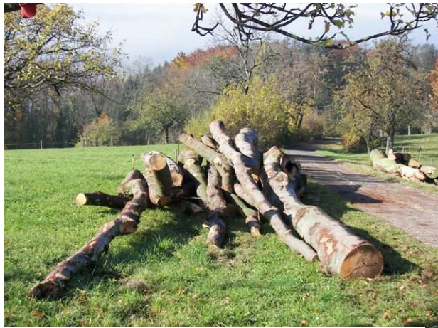
Halt u. „Blick zurück“ beim Hochbehälter der Wasserversorgung

...zum (guten) Schluss laden wir zu einer (Herbst-) Wanderung auf den Hohenstein, unseren Hausberg ein.