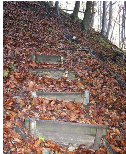
Auf dem Zick-Zack-Wegle geht es weiter