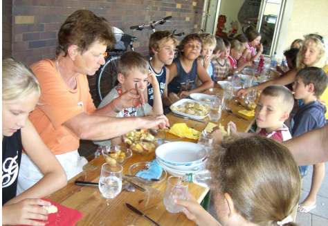
Auch beim Schülerferienprogramm wird auf das leibliche Wohl geachtet

Verwaltung und Vereine bieten den Kindern ein abwechslungsreiches Schüler-Ferien-Programm .