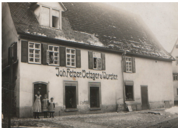
Metzgerei an der Einmündung der Pfarrstraße in die Große Gasse (z. Verf. Gest. von Lisa Fetzer)

Seit fast 2 Jahren gehören die Rubriken „...vor 50 Jahren und vor 25 Jahren stand in den Mitteilungen aus Gingen“ zu gern gelesenen Beiträgen, die z.T. auch ins Internet eingestellt werden. Interessiert? – Unter www.gingen.de können Sie gerne mitlesen.