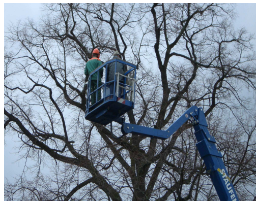
„Operation am jungen Holz“

Mitarbeiter des Bauhofes müssen aus Sicherheitsgründen die über 100 Jahre alte Linde am Rathausplatz beim Zebrastreifen an der Filsbrücke fällen. Die Kastanienbäume werden von schadhafte Ästen befreit“. Es ist nicht sicher, ob die Bäume überhaupt gehalten werden können.