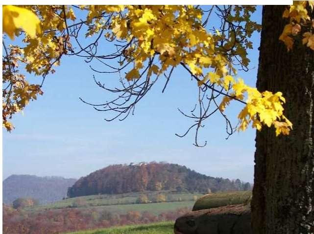
Im Nord-Westen grüßt das Scharfenschloß